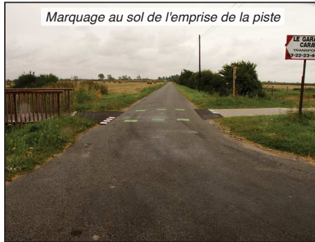
Marquage au sol de l'emprise de la piste