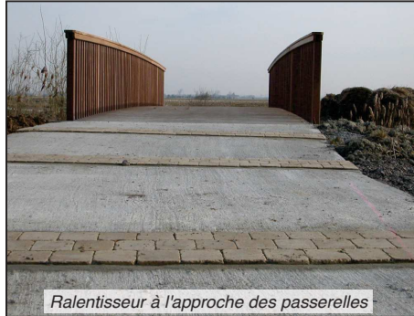
Ralentisseur à l'approche des passerelles