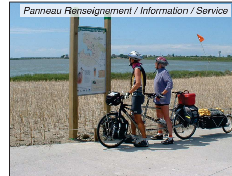
Panneau Renseignement / Information / Service

En ce qui concerne le paysage, les plantations effectuées dépendent du paysage environnant, aussi, les structures végétales rencontrées sur place seront le plus souvent reproduites.