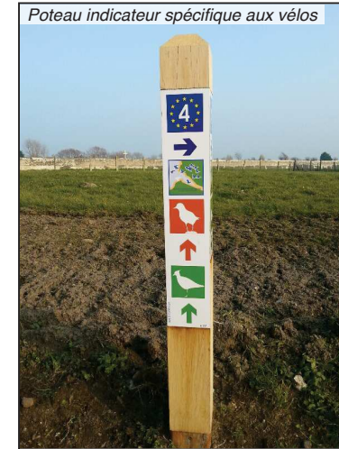
Poteau indicateur spécifique aux vélos